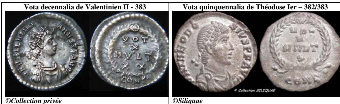
Siliques contemporaines des deux siliques de l'étude

Comme le montre le Chronogramme, la période de la mort de Gratien correspond aux vœux décennaux de son frère Valentinien II, et aux vœux quinquennaux de Théodose I. Des siliques sont émises au même moment dans l'atelier de Constantinople pour ces deux événements aux noms de ces deux Augustes.